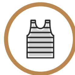
Tenue de sport et chaussures de salles propres