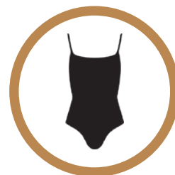
Maillot de bain (2 idéalement)