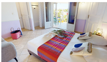
Chambre parentale avec nouveau mobilier à l'Hibiscus