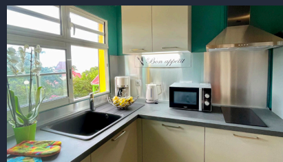
Nouvelle cuisine à Séo