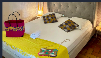
Chambre parentale avec nouveau mobilier à Séo