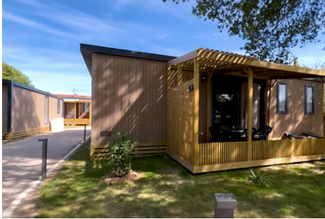
Mobil-home aux Bleus de l'Océan

Initié par les élus précédents puis mis en oeuvre par le bureau piloté par Olivier Tran, le projet d'investissement pour la réhabilitation et la rénovation du village vacances de Saint-Georges-de-Didonne (Charente) a vu le jour en juin 2022. Le village a été réinventé avec la volonté de créer des espaces modernes et confortables, respectueuses de la nature et des écosystèmes . Les mobil-homes sont composés à 90% de bois issus de forêts éco-gérées, recyclables à 100% et produits en circuits courts avec des usines implantées en France. Les logements sont tous équipés de TV et d'internet. La première exploitation a pu recueillir les premiers ressentis des agents qui sont globalement très satisfaits. L'offre de restauration absente de la première édition est programmée pour 2023.