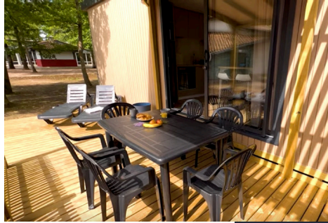
Terrasse ombragée aux Bleus de l'Océan