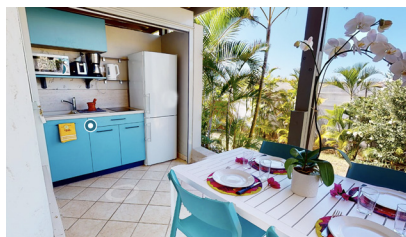
Cuisine rénovée à l'Hibiscus

Les 14 villages du patrimoine (9 villages adultes et 5 villages jeunes) nécessitent des investissements afin de les maintenir et de les entretenir. Une enveloppe de 1,5 à 2 M€ par an y est consacrée.