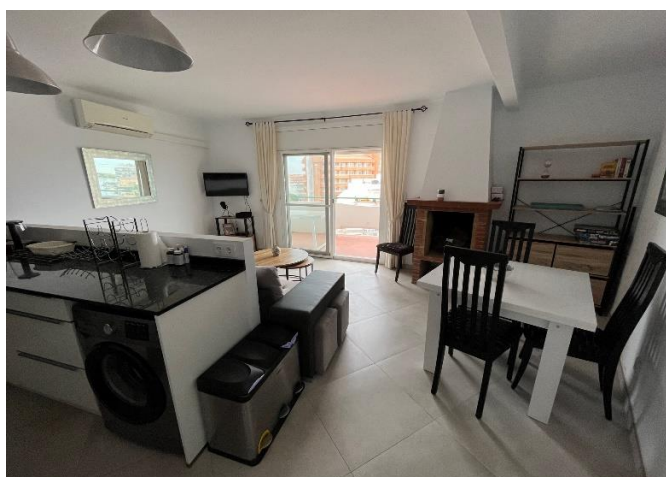
Cuisine & salon