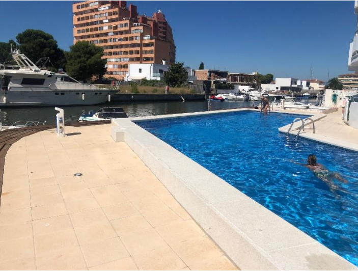
Piscine dans résidence