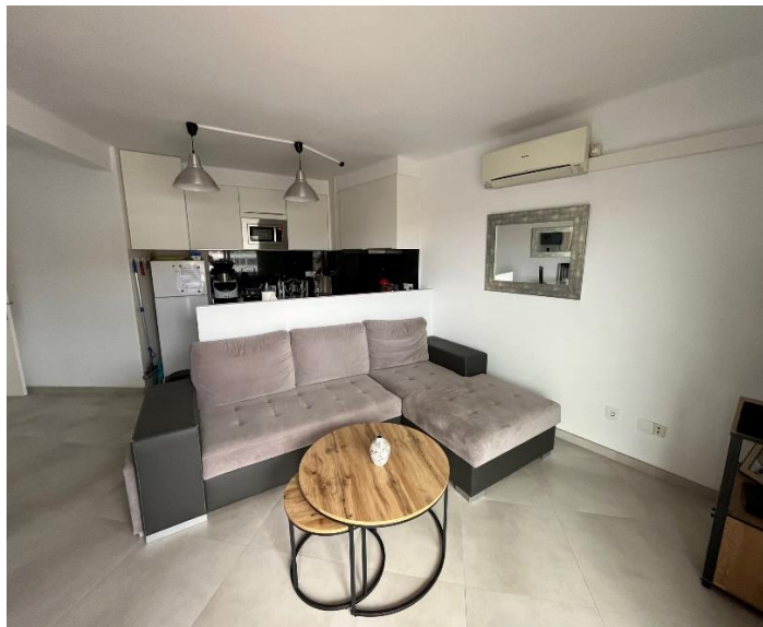
Salon + grand canapé convertible